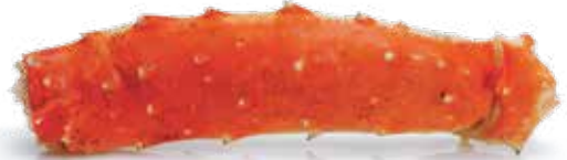
切口的蟹主要腿(梅鲁斯)